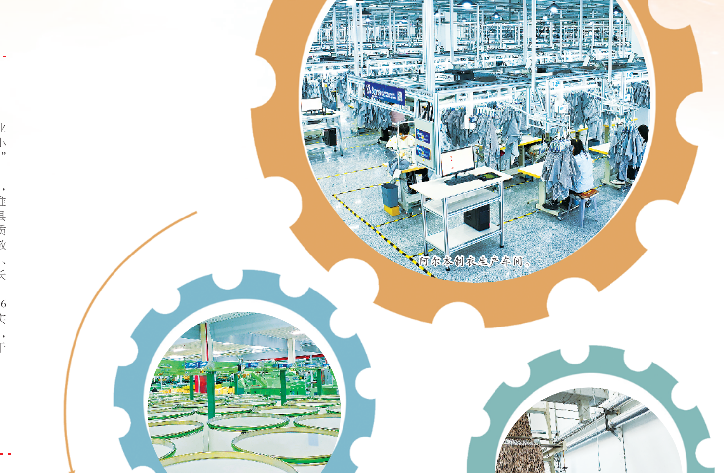
阿尔本制衣生产车间