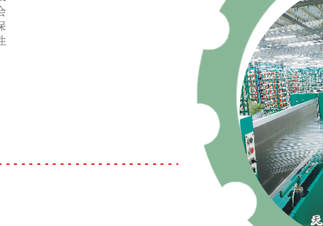
盛泰纺织生产车间